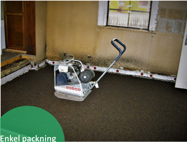
Enkel packning med vibroplatta