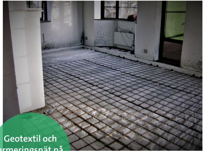
Geotextil och armeringsnät på lättklinkern

Leca® lättklinker, även kallat lecakulor, har använts i krypgrunder och torpargrunder i decennier. Materialet gynnar inte t.ex. hussvamp då leran som används vid tillverkning är kalkfattig.