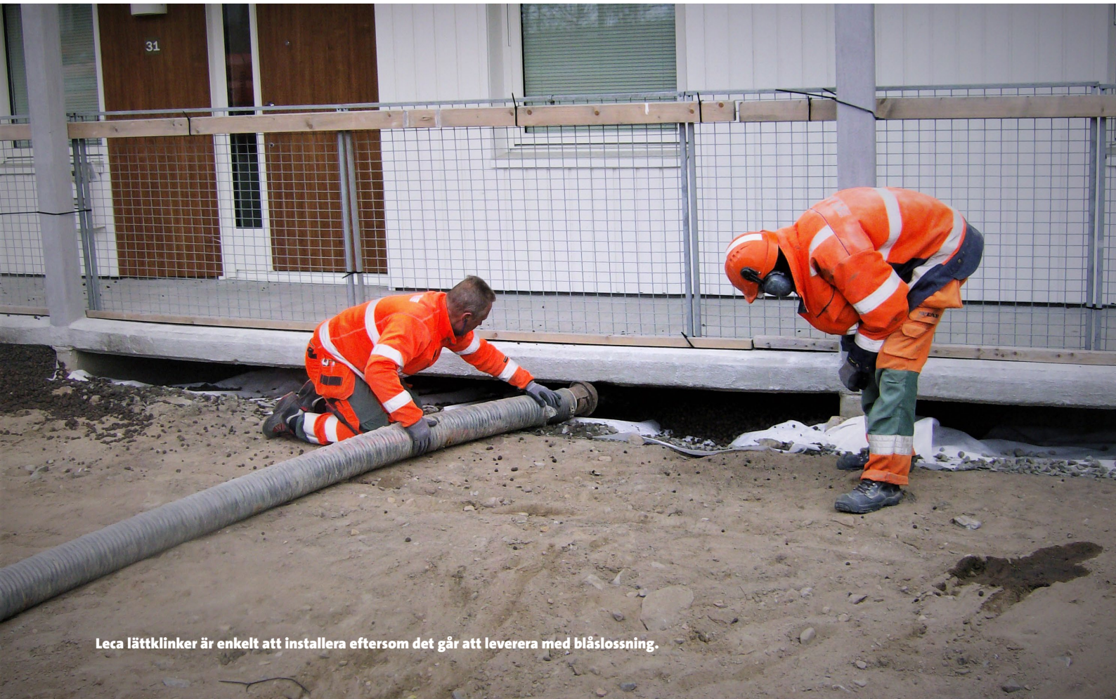
Leca lättklinker är enkelt att installera eftersom det går att leverera med blåslossning.

Leca® lättklinker, även kallat lecakulor, har använts i krypgrunder och torpargrunder i decennier. Materialet gynnar inte t.ex. hussvamp då leran som används vid tillverkning är kalkfattig.